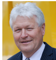
Joachim Herrmann, MdL

Bayerischer Staatsminister des Innern, für Bau und Verkehr